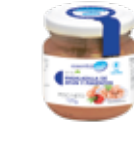
LA16 ENSALADILLA ATÚN Y PIMIENTOS

PROTEÍNAS HIDRATOS DE CARBOHIDRATO GRASAS 3g 0,4g 2,2g