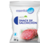
LA22 SNACK SALCHICHÓN

PROTEÍNAS HIDRATOS DE CARBOHIDRATO GRASAS 11g 1,2g 3,6g