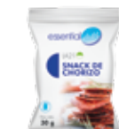
LA21 SNACK CHORIZO

PROTEÍNAS HIDRATOS DE CARBOHIDRATO GRASAS 16g 3,5g 6,2g