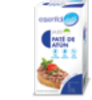
LA50 PATÉ DE ATÚN

PROTEÍNAS HIDRATOS DE CARBOHIDRATO GRASAS 11g 0,8g 3,7g