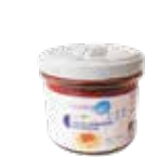
LA06 SALSA BOLOÑESA

PROTEÍNAS HIDRATOS DE CARBOHIDRATO GRASAS 14,60g 2,72g 0,99g