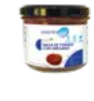
LA34 SALSA DE TOMATE CON ORÉGANO

PROTEÍNAS HIDRATOS DE CARBOHIDRATO GRASAS 16g 2,3g 3,3g