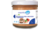
LA51 MOUSSE DE ATÚN, ANCHOAS Y PIMIENTOS

PROTEÍNAS HIDRATOS DE CARBOHIDRATO GRASAS 24g 0,22g 3,71g