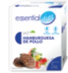
LA27 HAMBURGUESA POLLO

PROTEÍNAS HIDRATOS DE CARBOHIDRATO GRASAS 2,26g 1,28g 6,71g