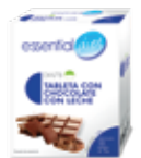
DM78 TABLETA CHOCOLATE CON LECHE

PROTEÍNAS 5,00g HIDRATOS DE CARBONO 0,60g GRASAS 4,30g