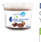
DL26 CREMA CHOCO. Y AVELLANAS

PROTEÍNAS 15g HIDRATOS DE CARBONO 4g GRASAS 9g