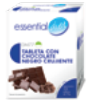
DM77 TABLETA CHOCOLATE NEGRO CRUJIENTE

PROTEÍNAS 3,37g HIDRATOS DE CARBONO 0,25g GRASAS 6,38g