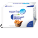
LA59 CROISSANT SALADO

PROTEÍNAS 15g HIDRATOS DE CARBONO 4g GRASAS 10g